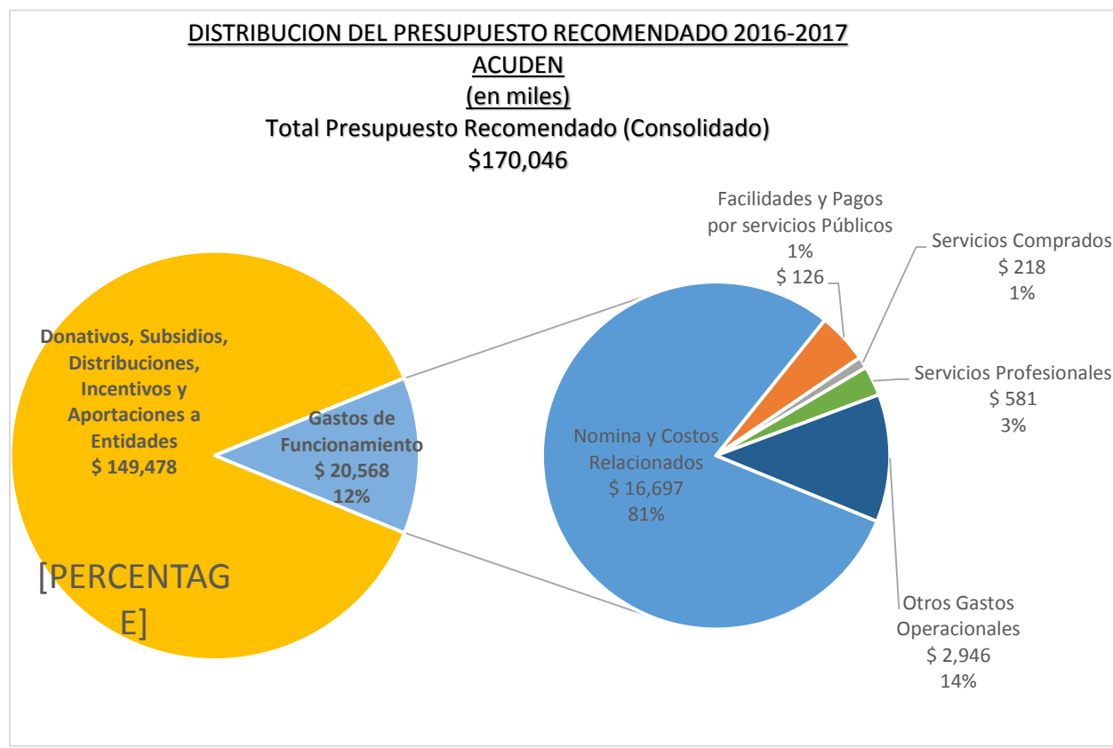
Gráfica 3-ACUDEN. Detalle del presupuesto recomendado para el año fiscal 2016-2017.

Fuente: Presupuesto recomendado por OGP.